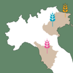
Oasi di Castelfiorentino, FI